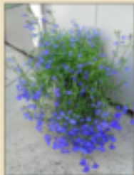
Вазон с лобелией