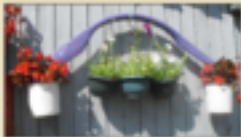
Подвесные вазоны «Коромысло с ведрами»