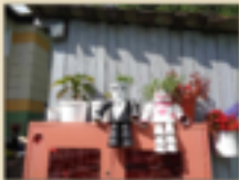
Композиция из вазончиков «Парочка»