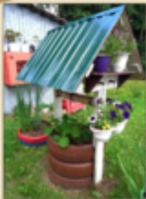
Композиция «Колодец» возле геронто- психиатрического отделения